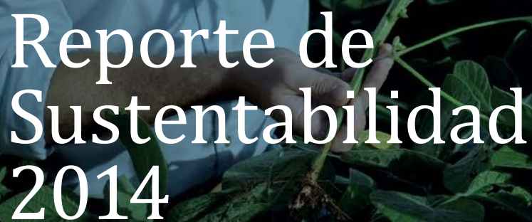
TABLA DE INDICADORES GRI e INFORMACIÓN COMPLEMENTARIA

PARA LOS 12 MESES TERMINADOS EN SEPTIEMBRE 2014